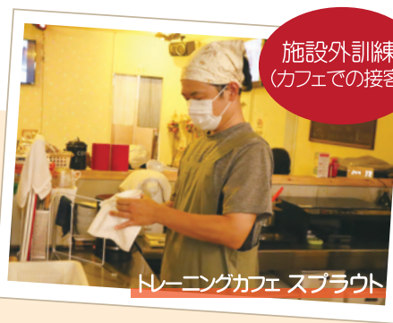
施設外訓練 (カフェでの接客)