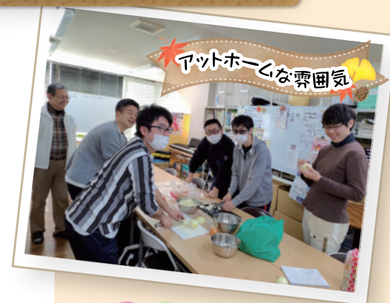
アットホームな雰囲気