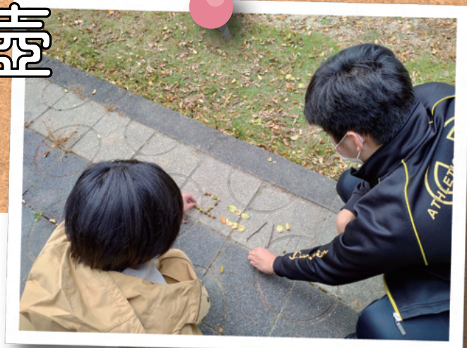
↑落ちていた枝や木の実で「ユニバ」を作る様子

ドイツでは「虹のふもとには光輝く金の壺がある」との言い伝えがあります。生活訓練「虹のふもと」にて、金の壺のようにきらめくみなさんの活動風景をお伝えしていきます。